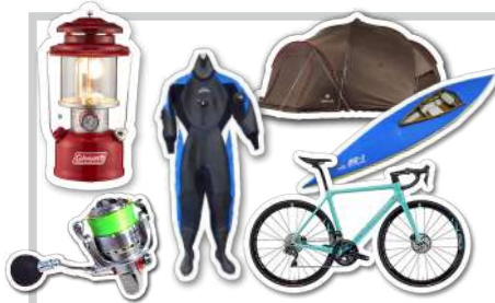
アウトドア・スポーツ